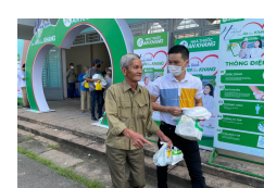
Hành trình Tâm An Thân Khang tại Bình Dương

“ Phát triển bền vững là phát triển đáp ứng được nhu cầu của hiện tại mà không làm tổn thương khả năng cho việc đáp ứng nhu cầu của các thế hệ tương lai