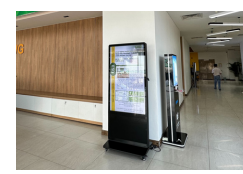
Bản tin ESG được phát trên các màn hình tại tòa nhà