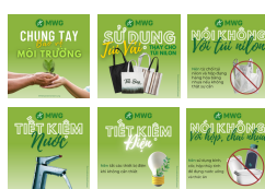
MWG ra mắt bộ ấn phẩm truyền thông ESG