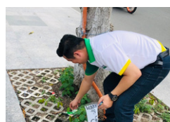
Các Tân quản lý tham gia dọn rác bảo vệ môi trường