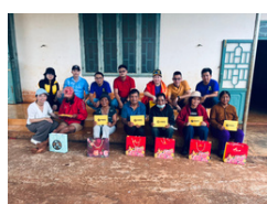
Chuyến đi Thiện nguyện đến Làng Phong Gia Lai