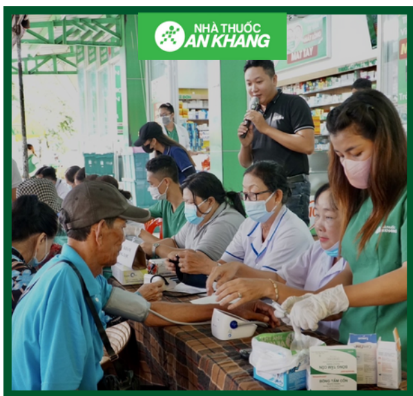
Hành Trình Tâm An Thân Khang #17: Kiên Giang & Cần Thơ