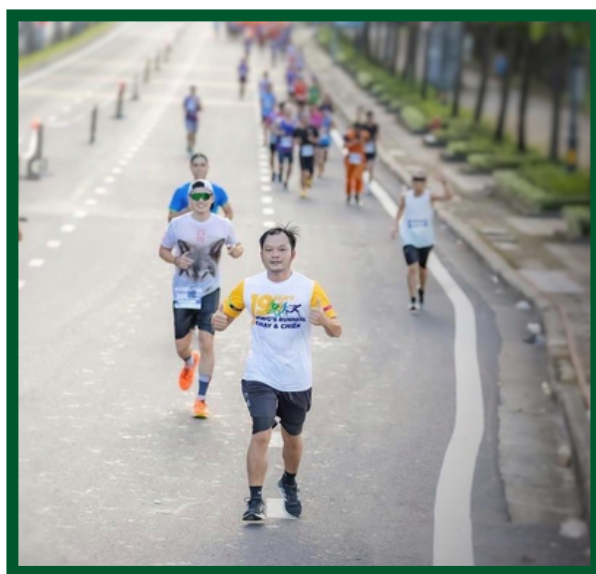
Đóng Góp Hơn 72 triệu Thông Qua Việc Chạy Bộ Gây Quỹ Vì Cộng Đồng - UPRACE 2023