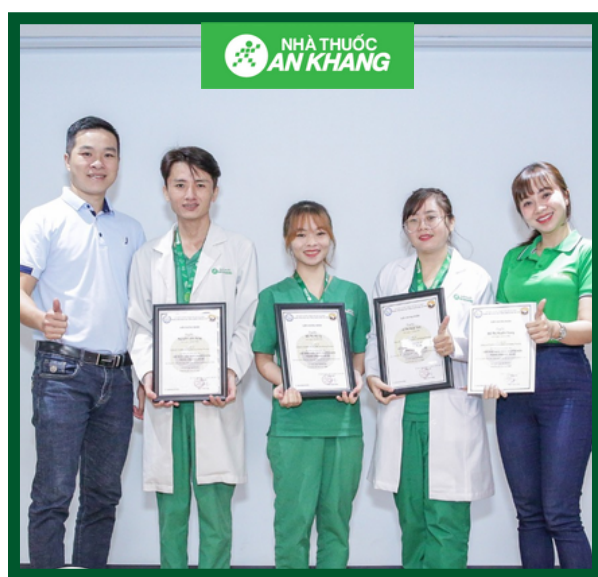
Các Lớp Học Nâng Cao Chuyên Môn Dược Sĩ An Khang