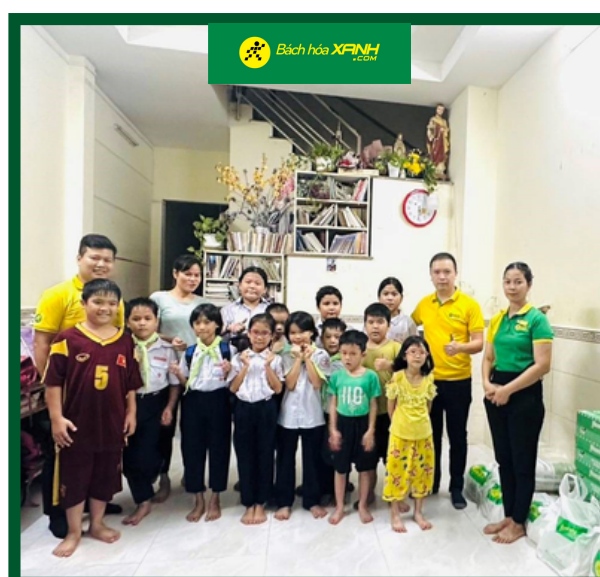
Hoạt Động Thiện Nguyện Khu Vực RSM Thanh Trà