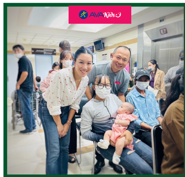
Hành Trình Quỹ "Nụ Cười AVAKids" Tại Bệnh Viện Đại Học Y Dược TP.HCM