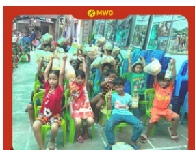
Người MWG vì cộng đồng