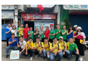
Thiện nguyện Khai xuân