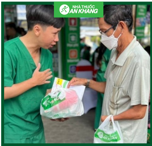
Hành Trình Tâm An Thân Khang #18: Cà Mau