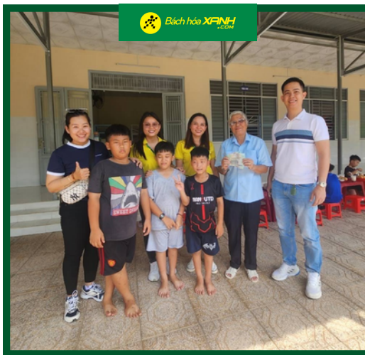
Thiện Nguyện Cần Thơ - Hậu Giang ở Mái Ấm Kim Hồng và Mái Ấm Thiên Ân