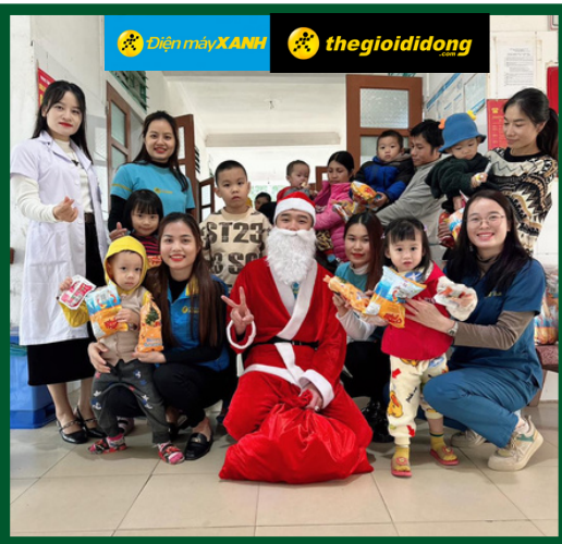
Điện Máy Xanh Kim Sơn: Tặng Quà Giáng Sinh cho Bệnh Nhi Trong Dịp Noel