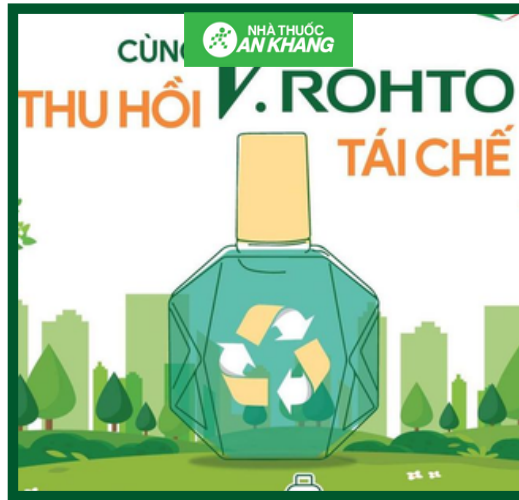
Chương trình “Thu gom và tái chế vỏ chai thuốc nhỏ mắt V.Rohto rồng”